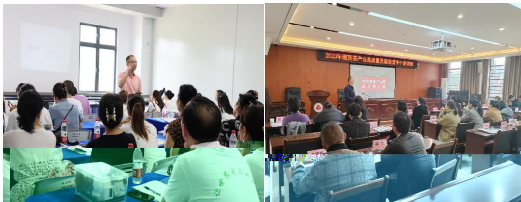
图 企业协助学校为湘西茶企开展电商直播培训

地的合，公不传 电，更关的创创。过大大 供创导，别茶工的操，公 鼓尝、敢创。方供锻 创的，方操的 合。