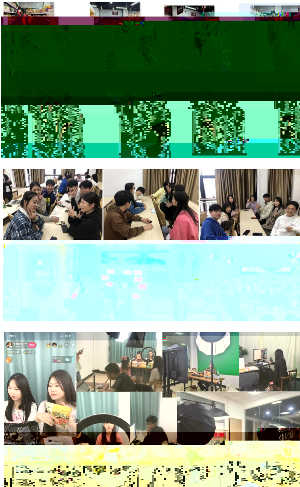
图 组织学生开展实习实训