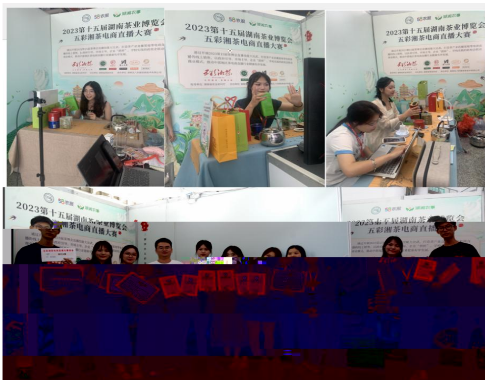
图 “湖南省第十五届茶博会” 电商直播比赛现场

播和方的，短 得的步。 队比10多单、单， 包但不、等多个，的 和队得的高度。的 得不对公的，更对参 付出和的充分定。