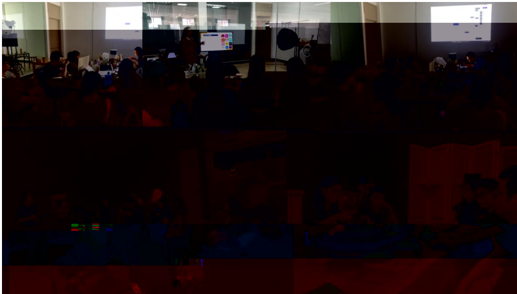
图 特邀企业专家来基地为学生进行专业培训

地 2023 地 ( 2), 供 宝贵的 。 过 的分 , 度 、 场变 , 对电 播 的 。 不 的 储备, 高 操 , 的 发 奠定 础。 措 合 的 度, 地 合 的 。